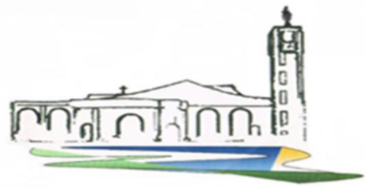
Parrocchia Buon Pastore Caserta