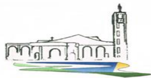
Parrocchia Buon Pastore Caserta